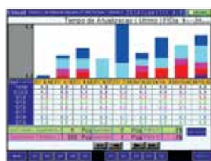
Gráfico de Falhas dos Processos

Acompanhar o estado de funcionamento do carregador automático e TORIDAS. Ex: 10 Maquinas TORIDAS e 2 Linhas (R e L).